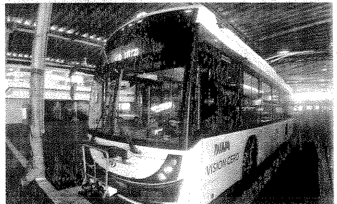
■ En talleres del STE se prueban tres unidades eléctricas; esta semana, una de ellas podría circular por Eje Central.

Ante la falta de disponibilidad de refacciones e incluso un recorte presupuestal al organismo en 2016, en el STE existe un taller para fabricar piezas para los trolebuses.