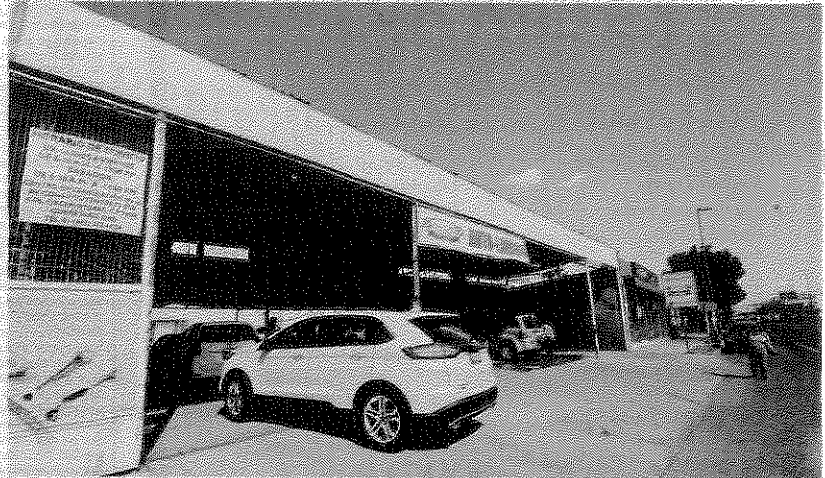
El auto, un jaguar 2004, no rebasó los límites de emisiones, pero por carecer del SDB obtuvo el holograma 1, lo cual inconformó a la casa de estudios.

por la Secretaría de Medio Ambiente, pero el Tribunal Colegiado que conoció del recurso de queja indicó que la tecnología que tengan los vehículos no varía el resultado de la emisión de los contaminantes.