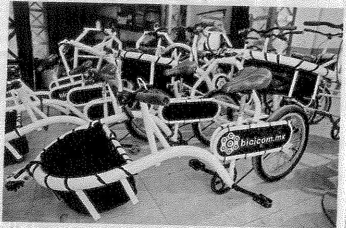
La empresa Bicicom creó las unidades para pasear a ciclistas, pero por ahora está impedida a dar servicio.

La subsecretaria de la Semovi habló de la demanda sin referirse a los operativos realizados, como acusó Dono-