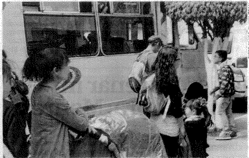
Para la puesta en operación del programa, el Gobierno de la CDMX adquirió 105 camiones, los cuales ofrecen servicio con un costo mensual desde 800 pesos.