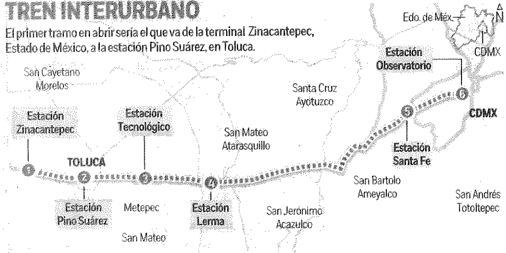
Gráfico: Horacio Sierra

El primer tramo en abrir sería el que va de la terminal Zinacantepec, Estado de México, a la estación Pino Suárez, en Toluca.