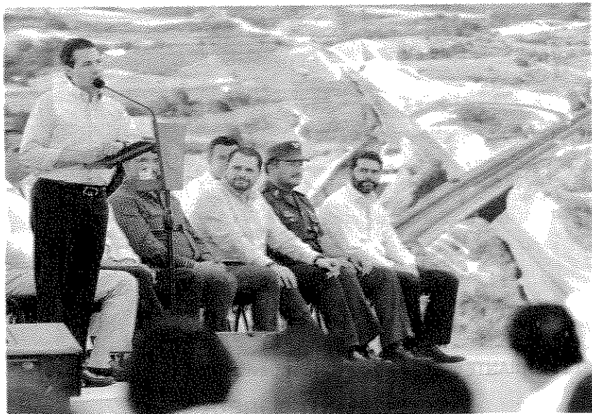
ENRIQUE PEÑA, Presidente de México, al inaugurar la carretera Tepic-San Blas.

EL PRESIDENTE afirma que las estrategias del Gobierno han impulsado el desarrollo económico de los estados; cuestionamientos siempre son bienvenidos, señala