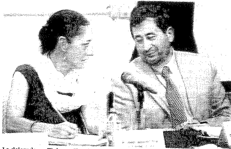
MADYA MURILLO, EL UNIVERSAL

La delegada en Tlalpan, Claudia Sheinbaum, compareció ante la Comisión de Administración Pública Local en la Asamblea Legislativa.