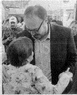
El asambleista encabezó el arranque de la celebración.

el diputado se retiró para dar paso a las cantantes, que junto con otras dos bailarinas en lencería atrajeron la atención de los adultos y niños en la explanada, para después dar paso a los mariachis.