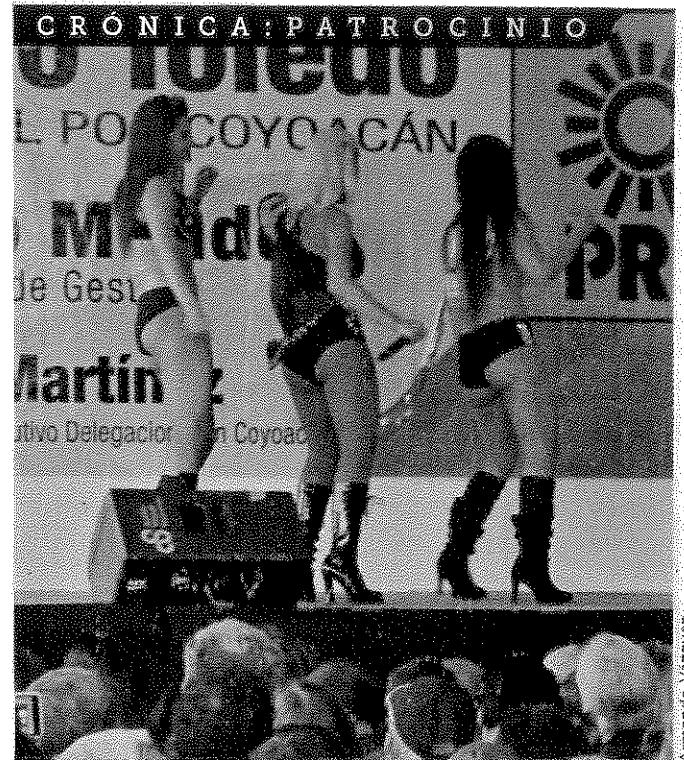
Invitadas por el perredista, las actrices bailaron ante vecinos de la Colonia CTM Culhuacán, en Coyoacán.

"El PRD no promueve cosificación de las mujeres. La imagen del PRD no debe usarse para ello. Le solicito retirar esa propaganda @mauriciotoledog", tuiteó la perredista.