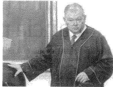
ÉDGAR ELÍAS, presidente del TSJ capitalino, el 28 de febrero.

Comentó que "quienes critican tienen la piel muy delgada, sólo fueron dos artículos", el 35 y 37, que afectan el desempeño del órgano del Poder Judicial al