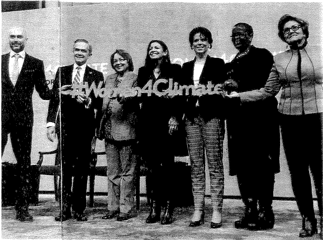
MIGUEL ÁNGEL Mancera (segundo de izq. a der.) en el foro Women4future en Nueva York, ayer.